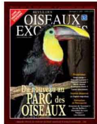
Toucan de Swainson